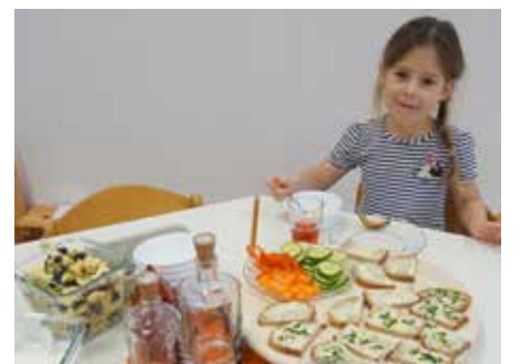
Fotos zu diesem Artikel: Kindergarten